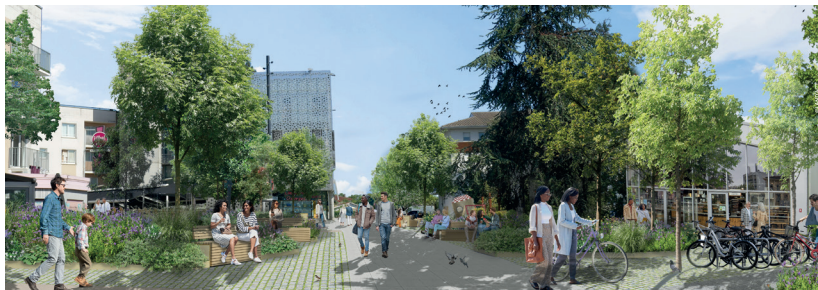
PLACE ALCALÁ DE HENARES

La Ville ouvre un nouveau chapitre pour la place Alcalá de Henares : vous avez pu le constater, les premières installations ont été réalisées, afin d'amorcer la requalification du cœur battant de notre ville en un lieu plus ombragé et convivial. Cette transformation sera progressive, avec des phases d'expérimentation, tout en maintenant le dynamisme auquel nous sommes tous attachés, grâce à la présence du Forum des Arts & de la Culture, du marché et l'attractivité des terrasses de nos commerçants.